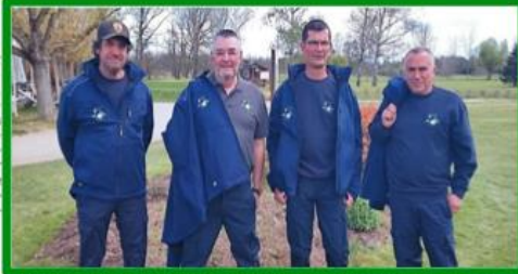
L'équipe des Jardiniers mis en avant pour cette compétition qui a vu triompher le club en bout

C'est dans le cadre du programme Golf pour la Biodiversité de la Fédération Française de Golf que le Golf du Forez s'inscrit dans une démarche environnementale structurée, convergant ainsi avec la nécessité de réduire les dépenses énergétiques. L'équipe de jardiniers est donc dans cet esprit de conversion dans une flore peu gourmande en consommation d'eau, par le réensemencement des parties défectueuses de greens par de nouvelles espèces de