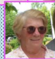
Gagnants tirage au sort