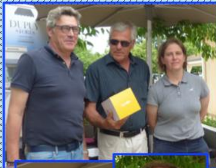
Primés Messieurs du FOREZ